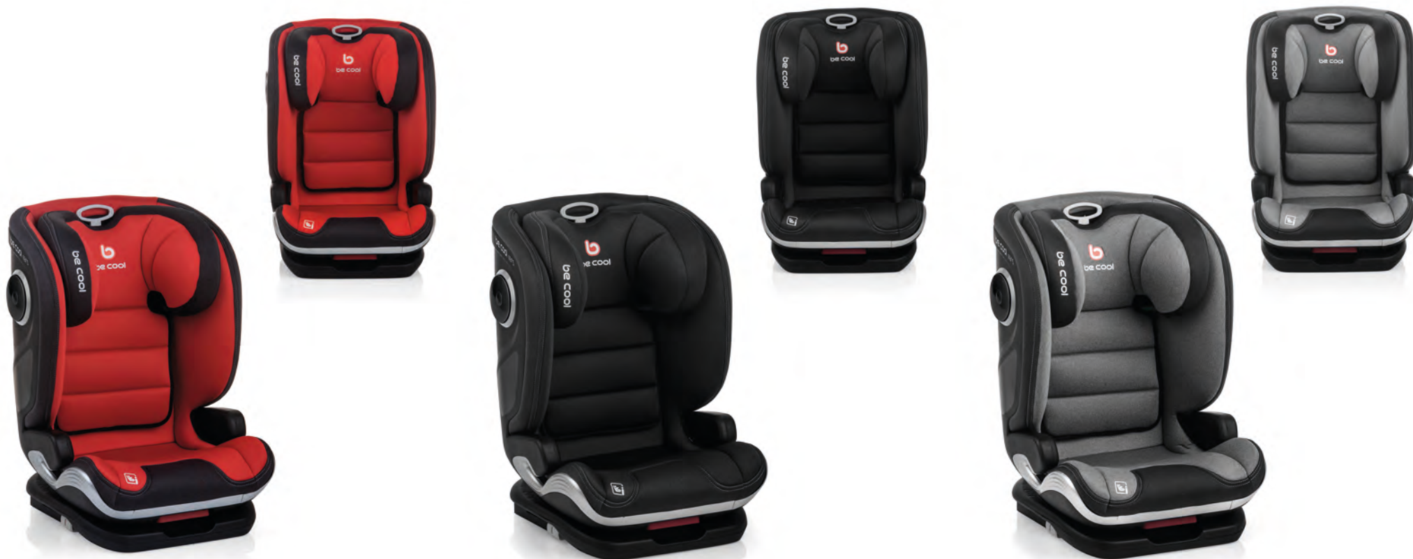
#BeScarlet 7023 Y75

IT Seggiolino omologato secondo la normativa i-Size R129 da 100 a 150 cm (fino ai 12 anni circa.). Le diverse altezze del poggiatesta fanno sì che il seggiolino si adatti al bambino durante la crescita e le diverse posizioni di inclinazione dello schienale lo fanno aderire perfettamente ai sedili dei diversi veicoli.