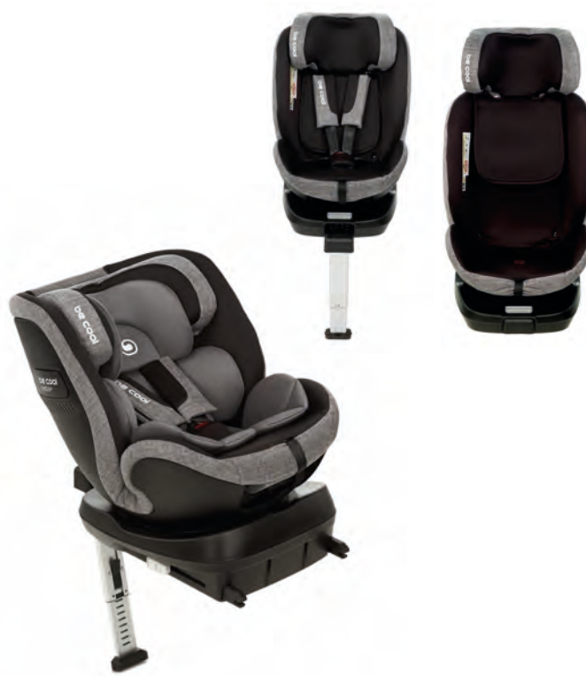
#BePenguin 7034 Z03

IT Il seggiolino di sicurezza Twister copre tutte le fasi di crescita del bambino, dalla nascita fino a 150 cm. Conforme alla normativa i-Size (R129) e dotato di agganci Isofix e barra di appoggio. Ruota di 360° con posizione di carico e scarico per il parcheggio. Offre una notevole protezione in caso di impatti laterali grazie al memory foam. Sotto la base è presente uno scomparto per tenere la barra nello stesso senso della direzione di marcia una volta che il bambino raggiunge i 100 cm.