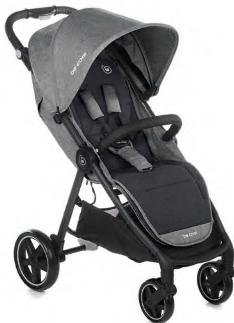
#BeGraphite 8034 Z16