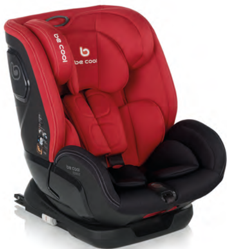
#BeScarlet 7042 Y75

IT Il seggiolino auto Space è omologato secondo la normativa i-Size per altezze comprese tra 76 e 150 cm. Si posiziona solo nel senso della direzione di marcia ed è dotato di cintura di sicurezza a 5 punti, Isofix e Top Tether. A partire dai 100 cm l'installazione avviene tramite i connettori isofix e la cintura a 3 punti dell'auto come sistema di trattenuta.