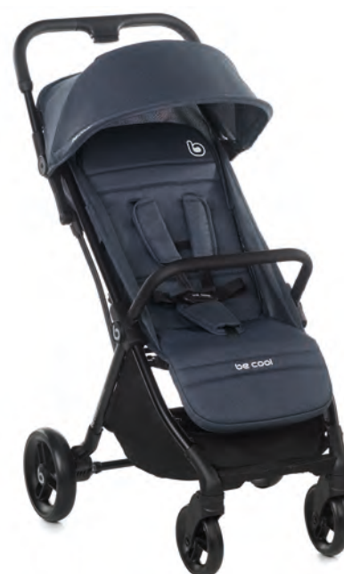
#BeAzure 8088 Z17