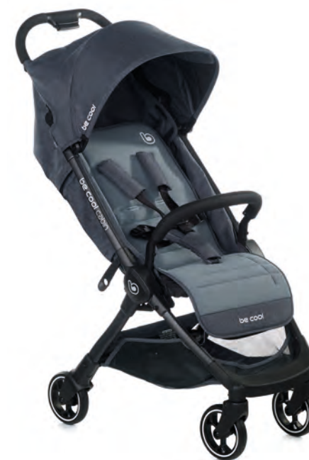
#BeAzure 8081 Z17