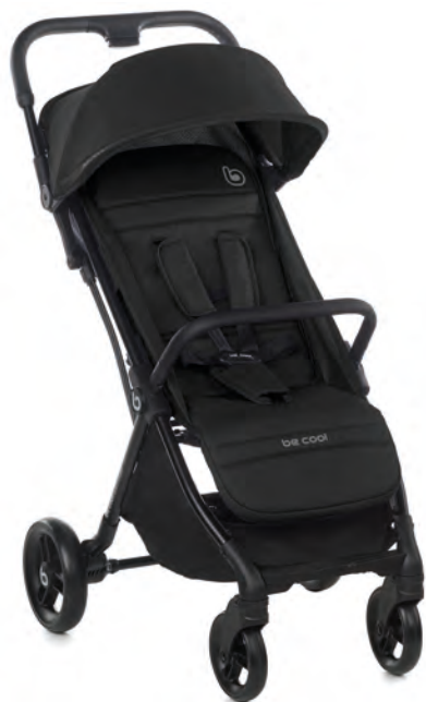
#BeOrbit 8088 Y91

IT Un passeggino leggero realmente pratico che si spinge facilmente e si piega automaticamente. Adatto dalla nascita fino ai 22 kg è molto confortevole anche per i bambini più grandi per il suo schienale molto alto (53 cm).