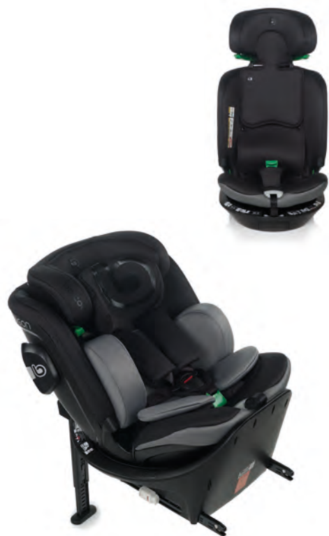
#BeCarbon 7036 Z13

IT Wagon è un sistema di ritenuta per bambini di tutte le età (40-150 cm) conforme alla normativa i-Size (R129) e dotato di agganci isofix e barra di appoggio. L'imbragatura resta all'interno della struttura della base offrendo un'ulteriore sicurezza. Ruota di 360° e offre posizione di carico e passaggio della cintura subaddominale che previene gli scivolamenti, migliorando così la protezione in caso di incidente.