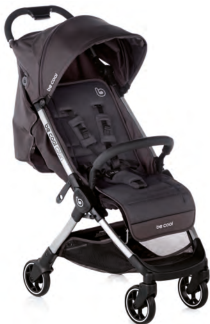
#BeOrbit 8081 Y91

IT Il passeggino leggero Cabin è molto pratico per passeggiare e viaggiare. Con un solo movimento si piega in maniera automatica e diventa così compatto che può essere riposto praticamente ovunque. È l'ideale per auto con il bagagliaio di dimensioni ridotte; inoltre, una volta chiuso rimane in piedi da solo. Adatto dalla nascita fino a 22 kg.