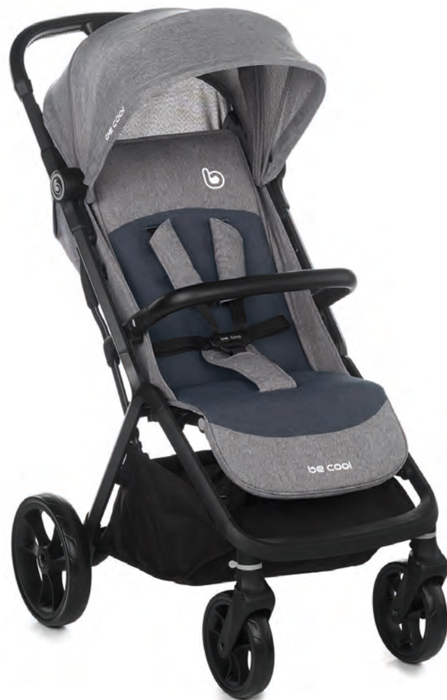
Stroller/Silla 8090 Z16