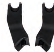
Connectors Urban Go 6913 AAA

Base con escudo antirotacional y con espacio extra para los pies (no incluida) Base with anti-swivel shield plate and with extra space for the child's feet (not included) Base avec bouclier anti-rotation et avec un espace extra pour les pieds (no incluida) Base con scudo antirotazione e spazio aggiuntivo per i piedi (non inclusa)