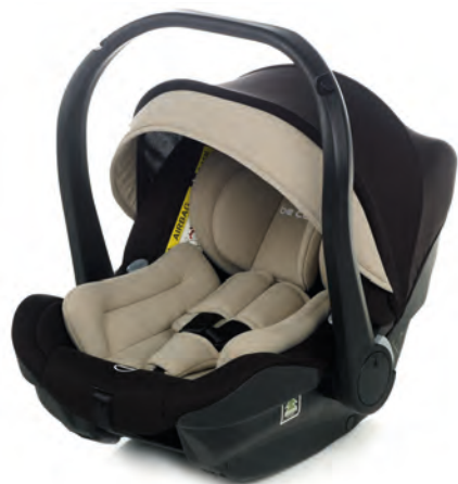
#BeRock 9015 Z20