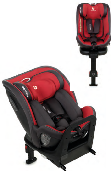
#BeScarlet 7038 Y75

IT Il seggiolino di sicurezza Fit è omologato secondo la normativa i-Size ed è idoneo dai neonati di 40 cm fino ai bambini di 105 cm. È stato progettato in modo che il piccolo viaggi in senso contrario alla direzione di marcia per tutto il tempo in cui può essere utilizzato (fino ai 105 cm), sebbene consenta viaggiare nello stesso senso della direzione di marcia dopo che il bambino ha raggiunto i 76 cm. È dotato di un riduttore che protegge il bambino durante i primi mesi, dopodiché il seggiolino viene adeguato allo sviluppo del bambino. Con lo stesso meccanismo, ruota di 360°, offre una posizione di carico ed è reclinabile in 4 posizioni.