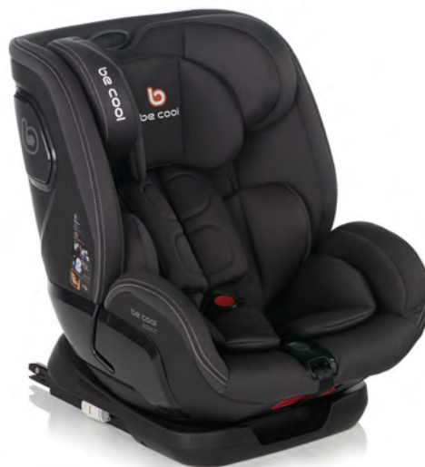
#BeDark 7042 Y76