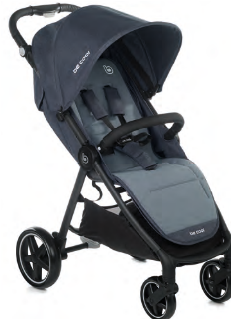
#BeAzure 8034 Z17