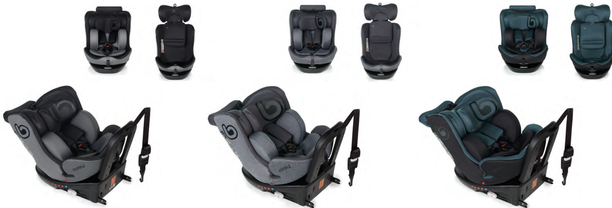
#BeCarbon 7037 Z13

IT Sicurezza e comfort in tutti i viaggi. Con questo sistema di ritenuta per bambini, i viaggi in auto sono comodi, facili e soprattutto sicuri. Easy è un seggiolino adatto dalla nascita fino ai 150 cm, molto ampio e comodo per i piccoli che crescono. Inoltre, ruota di 360° e offre una posizione di carico. È dotato di cuscino ammortizzatore posteriore per evitare lo scontro con il sedile anteriore in caso di impatto quando è orientato in senso opposto alla direzione di marcia. È conforme alla normativa i-Size (R129) ed è dotato di agganci Isofix e Top Tether nel sistema antirotazione per agevolare la rotazione durante il parcheggio.