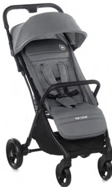
#BeGraphite 8088 Z16