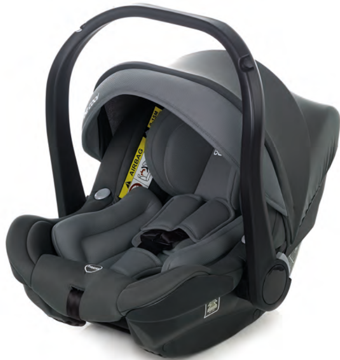
#BeGreyer 9015 Z21