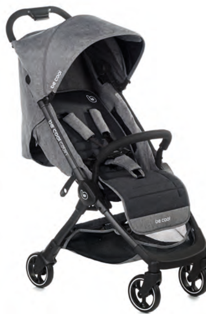
#BeGraphite 8081 Z16