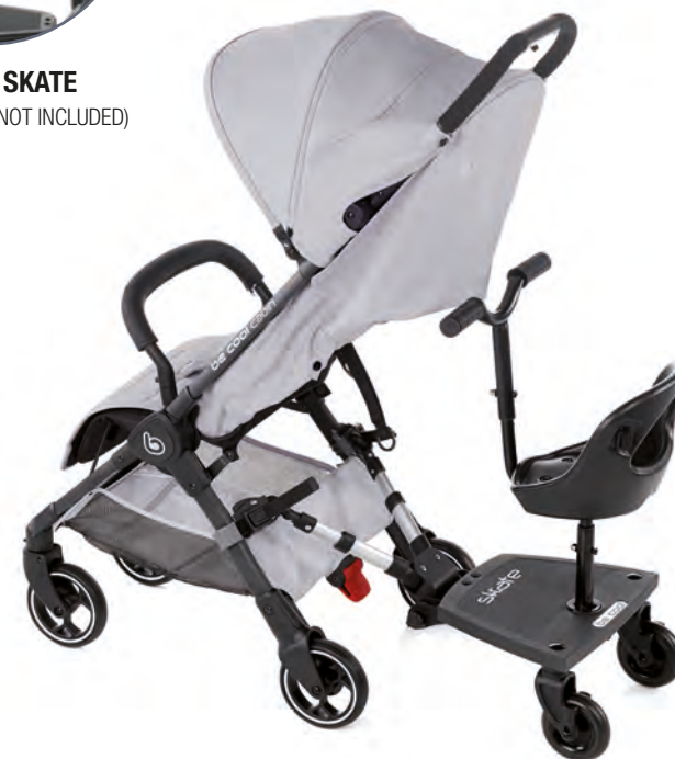
Seat 503 AAA

ES Plataforma universal para llevar a un segundo niño de pie, con opción de incorporar un asiento. EN Universal platform to carry a second child standing up, with the option of fitting a seat. FR Plateforme universelle pour porter un deuxième enfant debout, avec possibilité d'intégrer un siège. IT Piattaforma universale per portare un secondo bambino in piedi, con la possibilità di inserire una seduta.