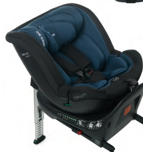
#BeCarbon 7044 Z13