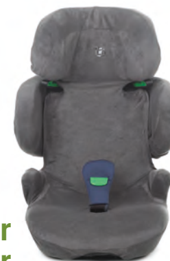
Grey 6909 Y98