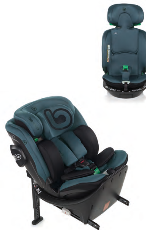
#BePetrol 7036 Z15