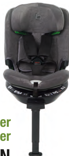
Grey 6910 Y98