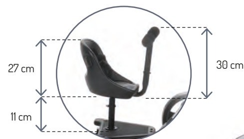
SEAT + SKATE (NO INCLUIDO / NOT INCLUDED)