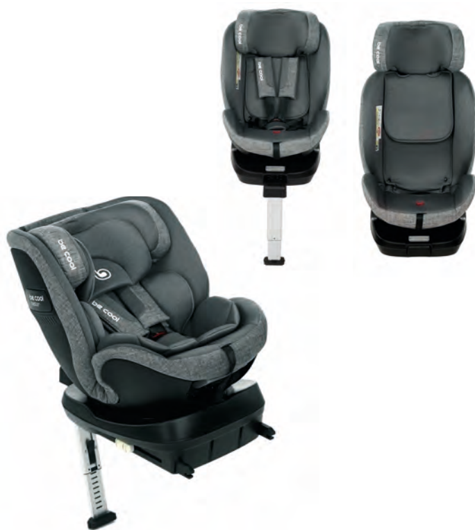
#BeCity 7034 Z02

EN The Twister car seat can be used for all stages of the child's growth, from birth up to 150 cm. It complies with the i-Size (R129) regulations and has isofix anchors and a support leg. It has 360° rotation with loading and unloading positions when parked. Offers great protection in the event of a side impact thanks to its memory foam. With a compartment under the base in order to store the leg for forward-facing use from 100 cm.