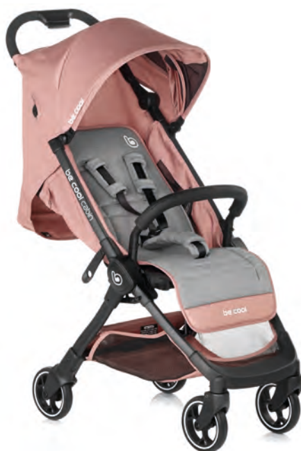
#BeRosegold 8081 Y62