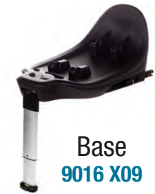
Base 9016 X09

Uso desde el nacimiento For use from birth Apte dès la naissance Utilizzabile fin dalla nascita