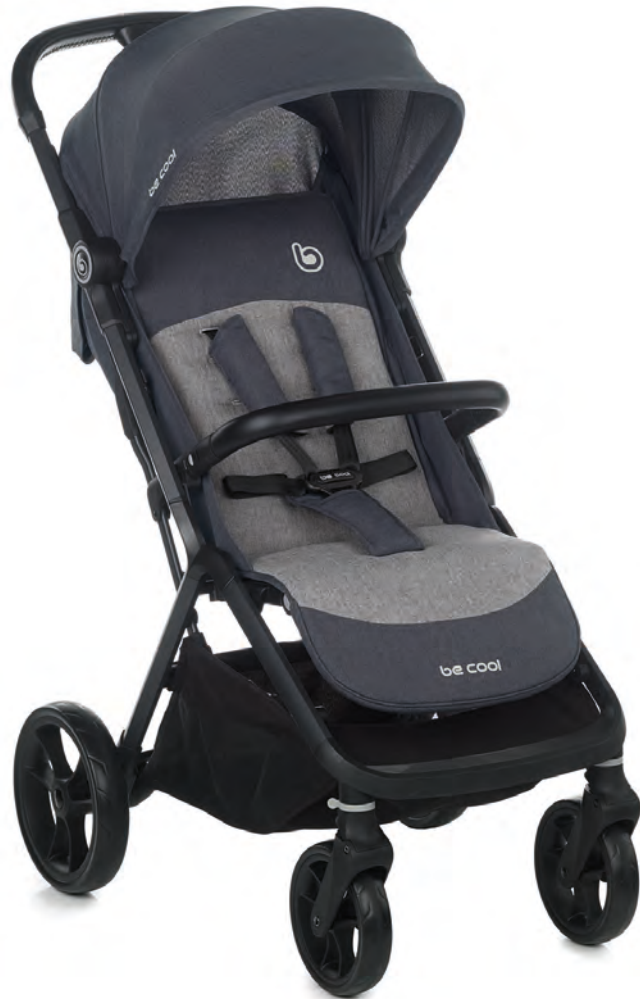
Stroller/Silla 8090 Z17