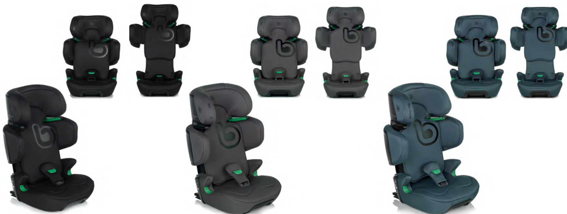
#BeCarbon 7035 Z13

IT Foldy offre la sicurezza in auto da 100 a 150 cm (fino a 12 anni circa) con omologazione ai sensi della normativa i-Size R129. Si caratterizza per comodità e praticità. Il seggiolino Foldy si chiude facilmente ed è dotato di un'impugnatura per il trasporto quando è chiuso e compatto. Per i bambini è comodissimo perché è regolabile indipendentemente in altezza e larghezza. Con il seggiolino Foldy la sicurezza è garantita grazie al passaggio della cintura subaddominale che impedisce lo scivolamento in caso di impatto.