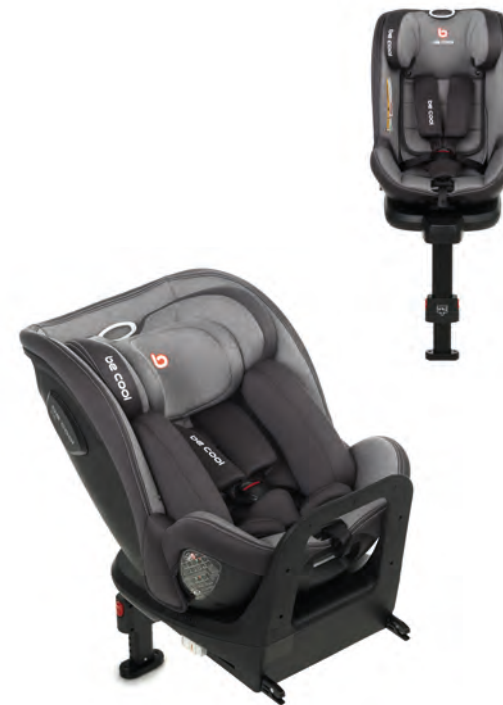
#Belron 7038 Y77