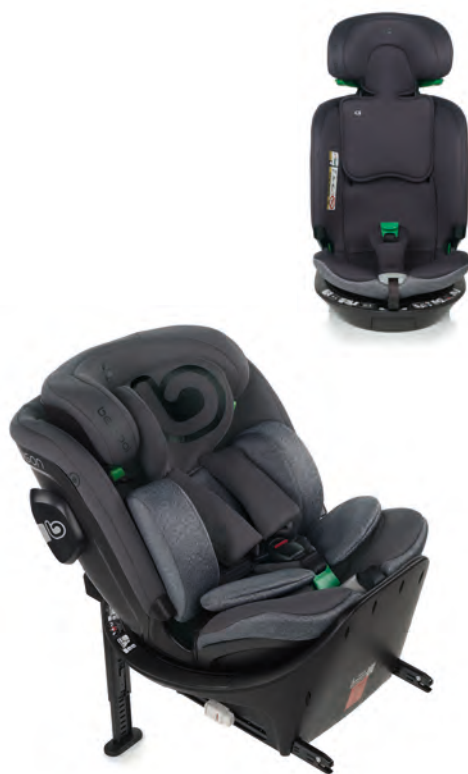
#BeAntracita 7036 Z14