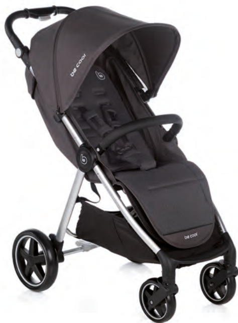
#BeOrbit 8034 Y91

IT Ultimate è stato sviluppato per avere un passeggino con più spazio e comodità per il bambino e al tempo stesso maneggevole e leggero per le mamme e i papà. Adatto dalla nascita fino a 22 kg.