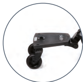
Skate 502 AAA