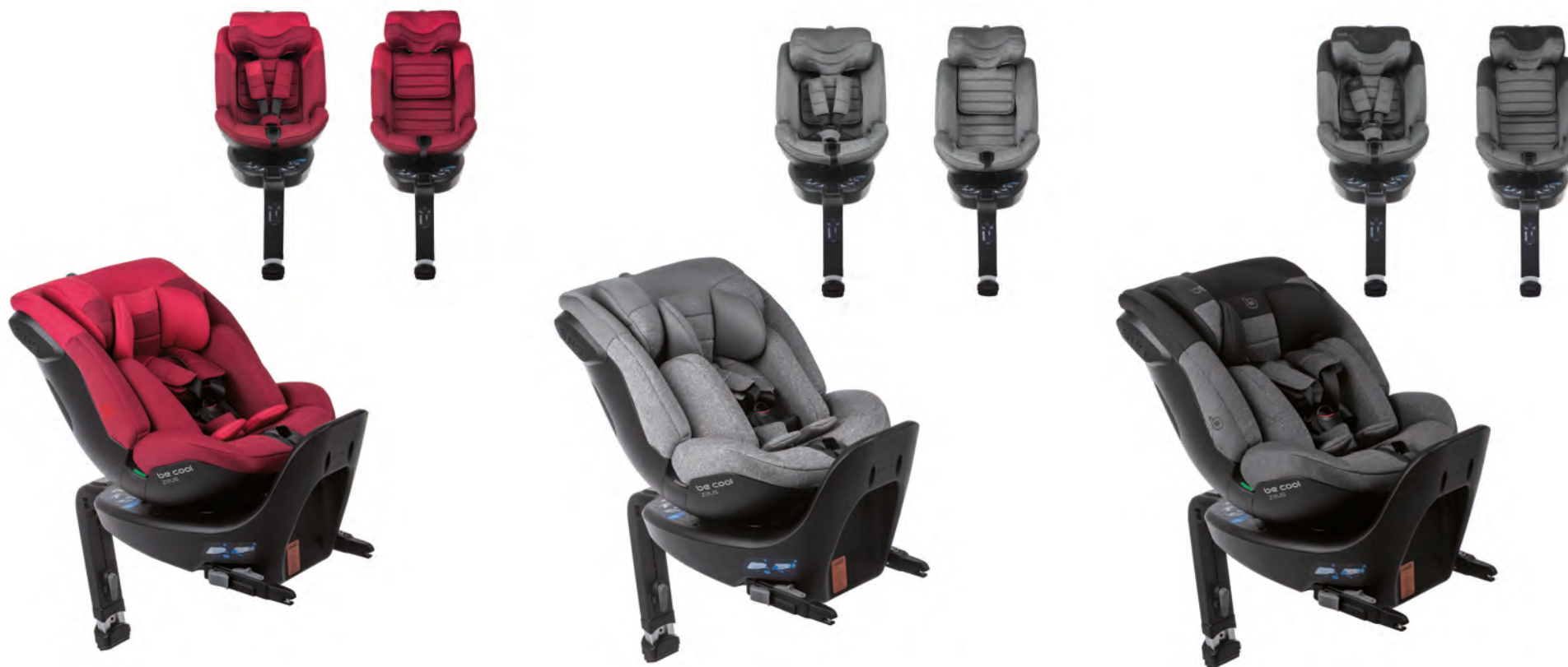
#BeCherry 7020 Y65

IT Con il seggiolino per auto Zeus il bambino viaggia sicuro dalla nascita fino ai 125 cm (fino a 105 cm nel senso contrario alla marcia). È molto semplice da installare e garantisce una stabilità eccellente all'interno del veicolo. Omologato secondo la normativa i-size R129, è adatto dai 40 ai 125 cm di altezza ed è molto pratico grazie alla rotazione di 360° con posizione di carico.