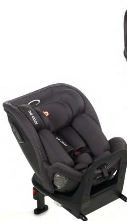
#BeDark 7038 Y76