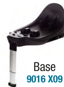
Base 9016 X09

Uso desde el nacimiento For use from birth Apte dès la naissance Utilizzabile fin dalla nascita