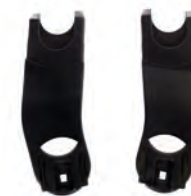
Stroller/Silla + Carry cot/Capazo Stratos + Travel carrier + Connectors (included) 8092 Z19 + Base 9016 X09