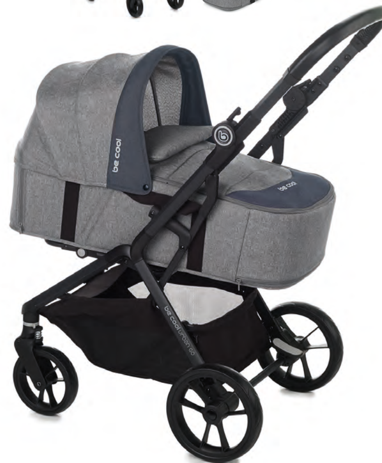
Stroller/Silla 8090 Z16 Carry cot/Capazo Dream Go 9014 Z18