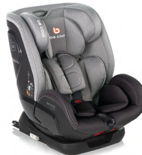
#BeIron 7042 Y77